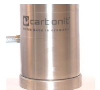
SANUNO inoxF mit Fuß

Weitere Informationen, Gutachten, Zertifikate und aktuelle Entwicklungen finden Sie im Internet unter www.carbonit.com / Mein Filter.