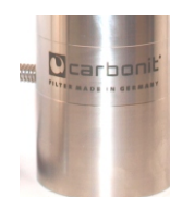
SANUNO inoxS Standard