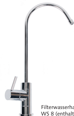
Filterwasserhahn WS 8 (enthalten)